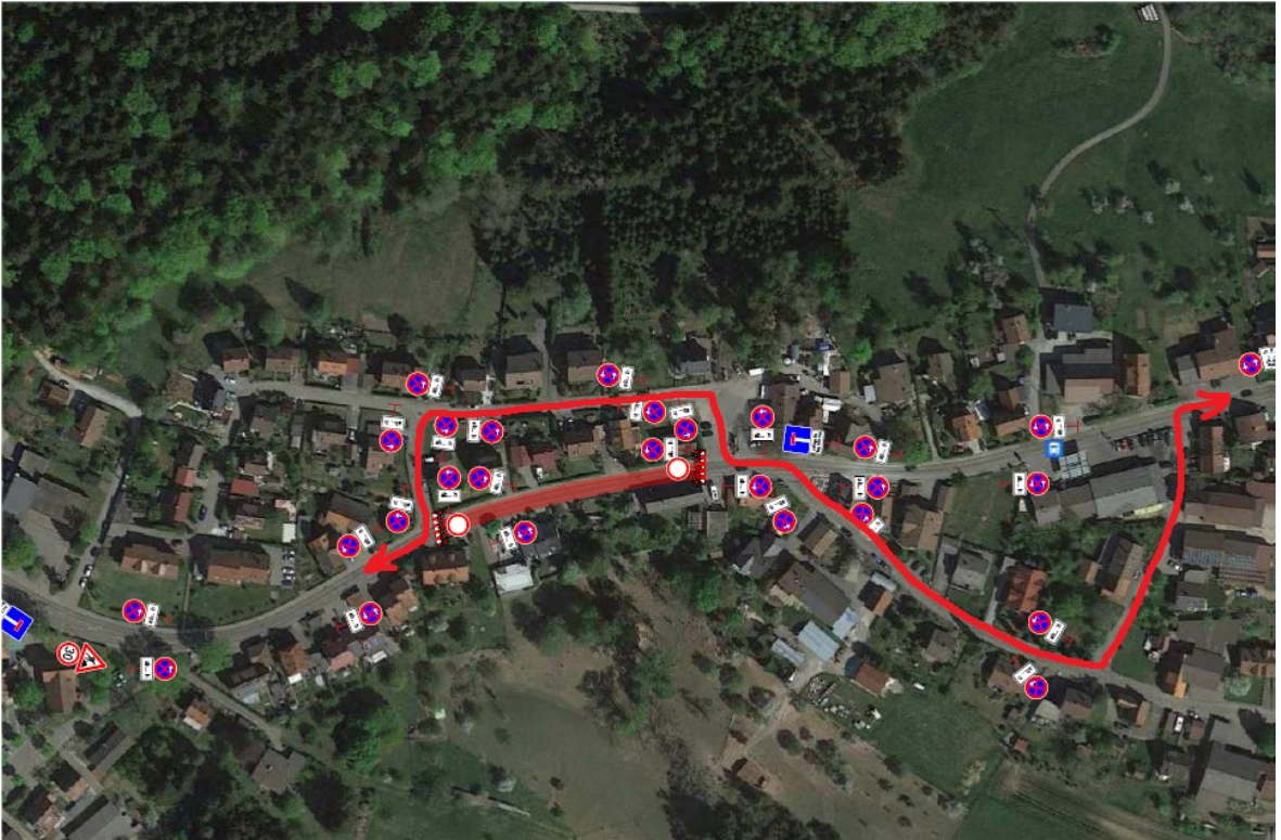
Befahrbarkeit für Anlieger über Wolfsgarten – Lerchenstraße - Finkenstraße